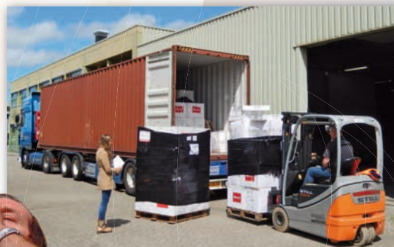
Goederen laden in Den Haag

zich in het beter verstaan van wat de vernieuwing van de voorwaarden bij het eerste Verbond inhoudt. Yeshua is Heer van de Sabbat en vervulde alle gedenkdagen in de voorjaarsfeesten en in de najaarsfeesten. De voorjaarsfeesten kennen we voor een deel, die wijzen echter heen naar de najaarsfeesten. Wat betekent dat in de geloofspraktijk? Dat wij daar vorm aangeven op een wijze die het vernieuwde verbond aanreikt. We nemen de overleveringen en gebruiken van de Joden niet over of er moet een duidelijke basis in het geschreven Woord voor te vinden zijn. Dat is een soms wat lastige zoektocht maar wel één die je geloofsleven voortdurend verrijkt en vernieuwt." Lees meer op de site!