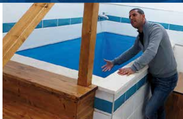
Het doopbasin van de gemeente