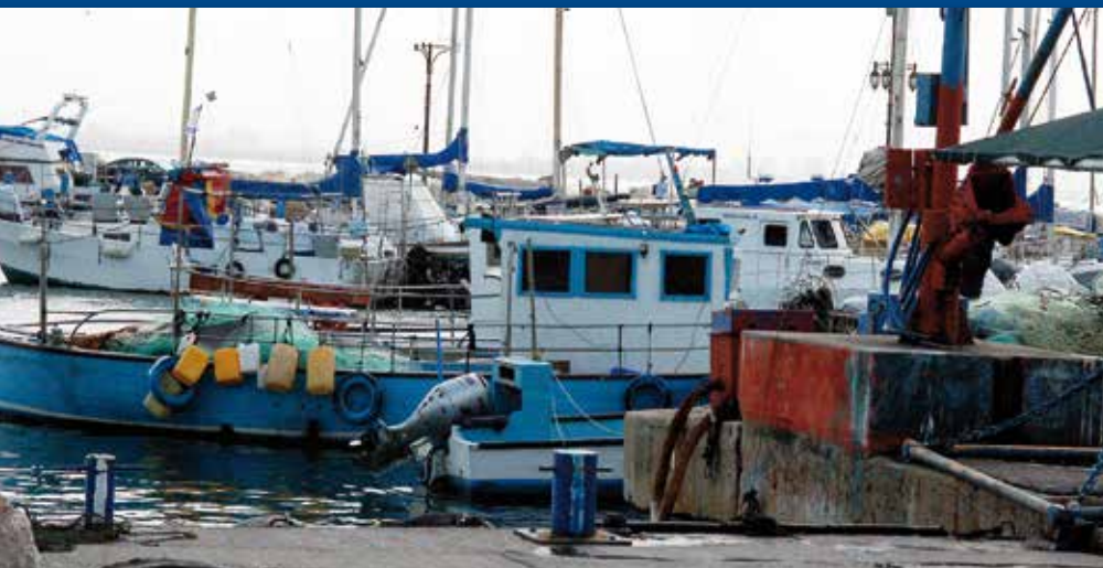
De haven van Akko