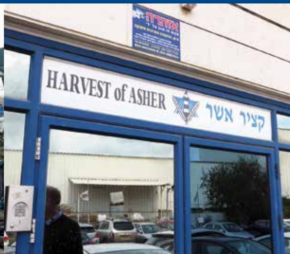
Ingang van het huidige pand van 'Katsir Asher'

waarin de Messiaanse gemeente, de kinderactiviteiten en al onze andere activiteiten gehuisvest kunnen worden. Vooral voor de uitbreiding van het kinderwerk is dat noodzakelijk. Nu komen er per keer vijfenveertig kinderen naar de buitenschoolse activiteiten, maar dat is echt het maximum. Ook zouden we nog meer activiteiten willen toevoegen zodat ieder kind zijn of haar talenten nog beter kan ontwikkelen. Nu zijn er zeven activiteiten waaruit ze kunnen kiezen, maar in de toekomst hopen we veel meer disciplines aan te kunnen bieden. We hebben de bouwplannen al klaarliggen, nu de financiën nog.'