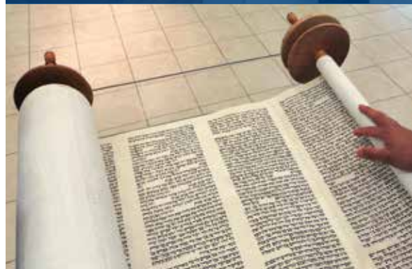
De Torarol waaruit op Sabbat wordt voorgelezen