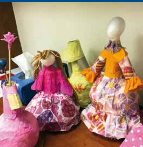
Creatieve uitingen van de kinderen