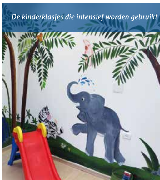
De kinderklasjes die intensief worden gebruikt

'Maar onze droom gaat verder. Wij willen op termijn heel graag een centrum bouwen waar veel meer kinderen kunnen komen. Een multifunctioneel gebouw